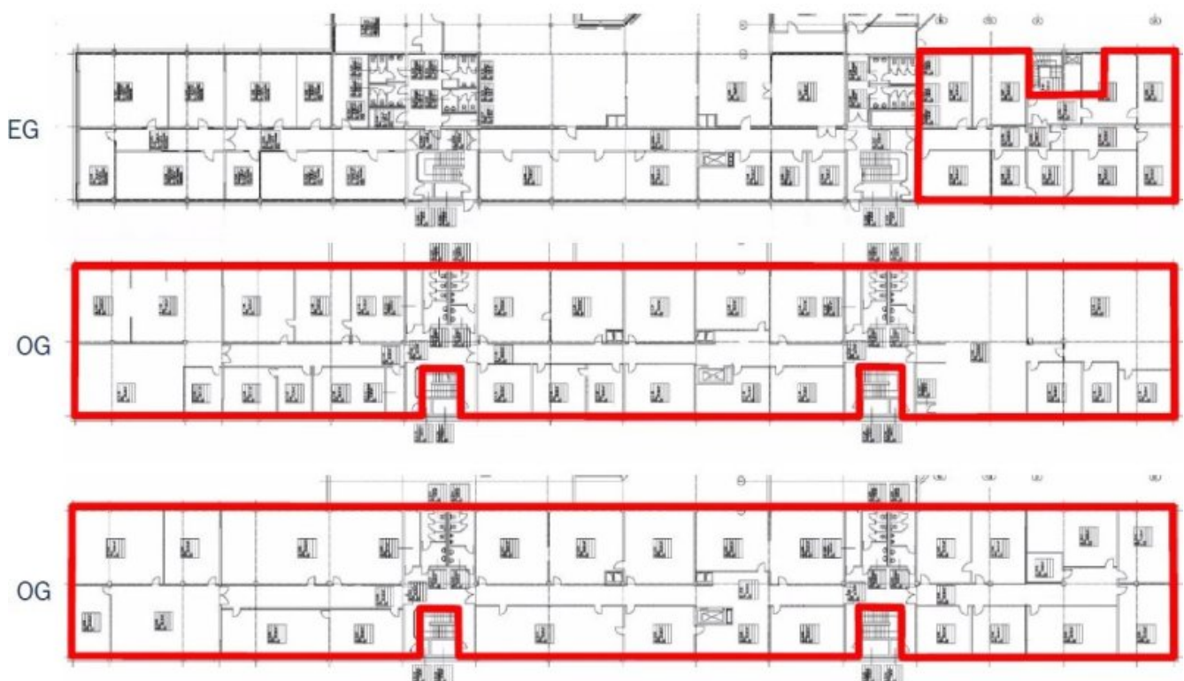
Grundriss Gebäude 1 Flächen (Grundriss)