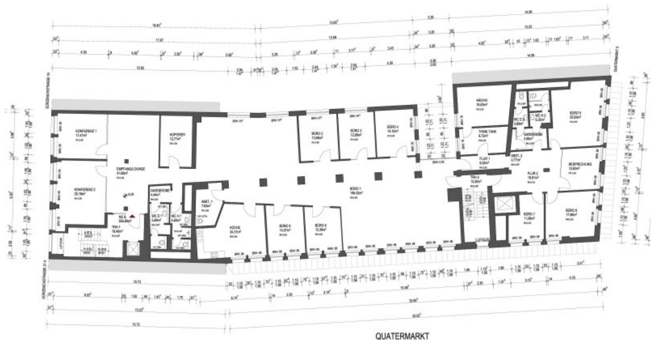
Grundrissplan 2.OG (Grundriss)