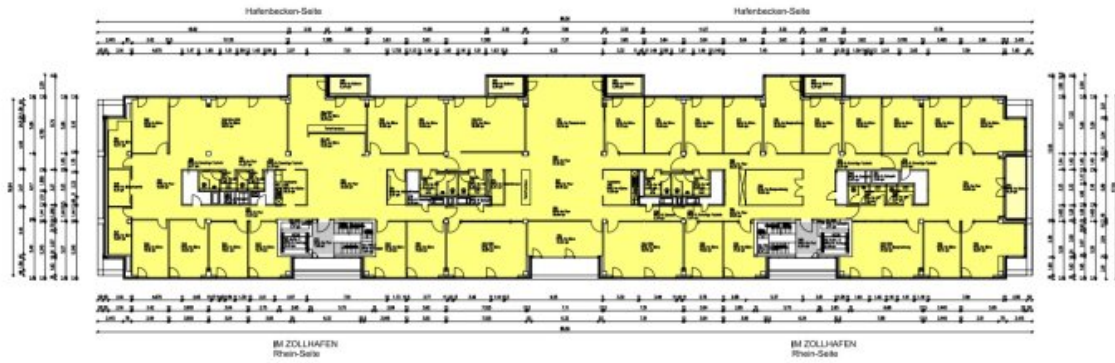
Grundriss 2.OG (Grundriss)