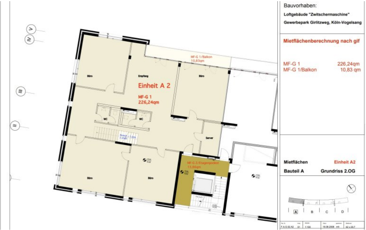
Grundrissplan 2.OGA2 (Grundriss)