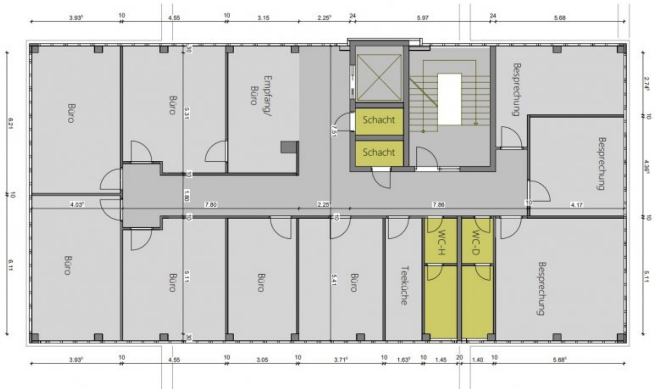
Grundrissplan 5.OG 321 m 2 (Grundriss)