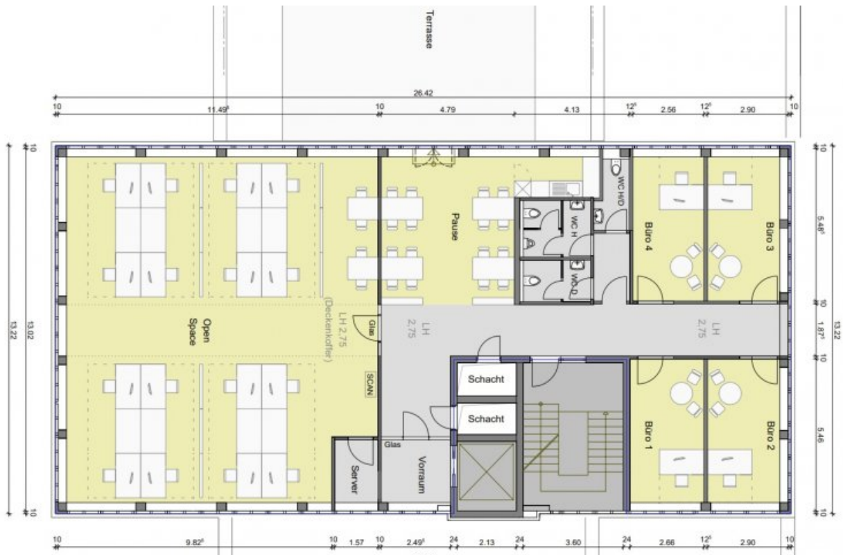
Grundrissplan 5.OG 404 m 2 (Grundriss)