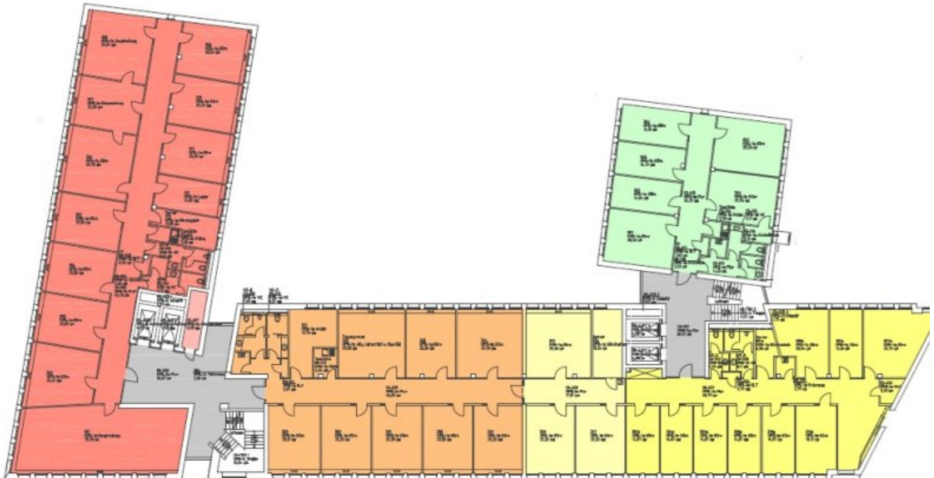
Grundrissplan 3OG orangehellgelb (Grundriss)