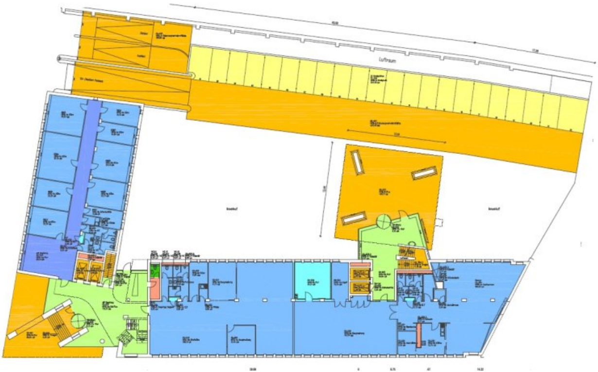
Grundrissplan EGlücksblau (Grundriss)