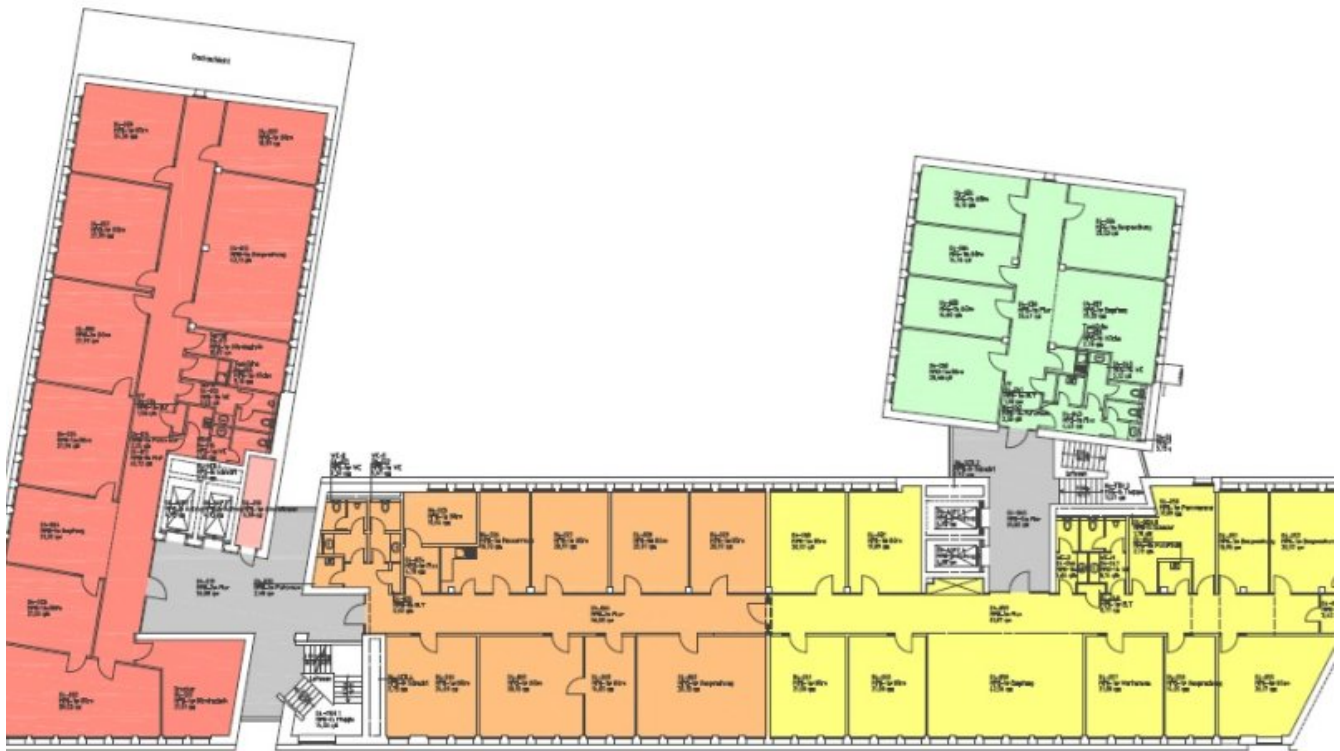
Grundrissplan 4OG Gelb (Grundriss)