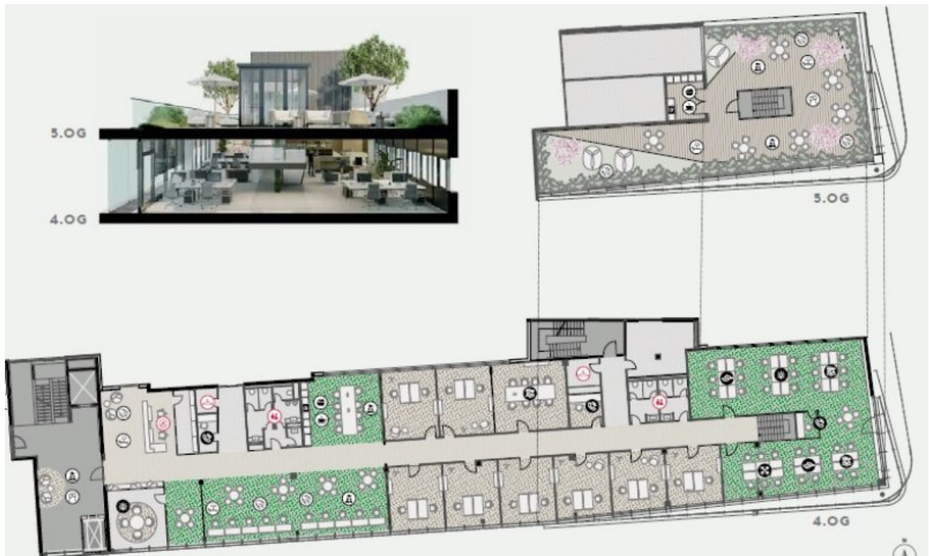
Grundrissbeispiel The Terrace (Grundriss)