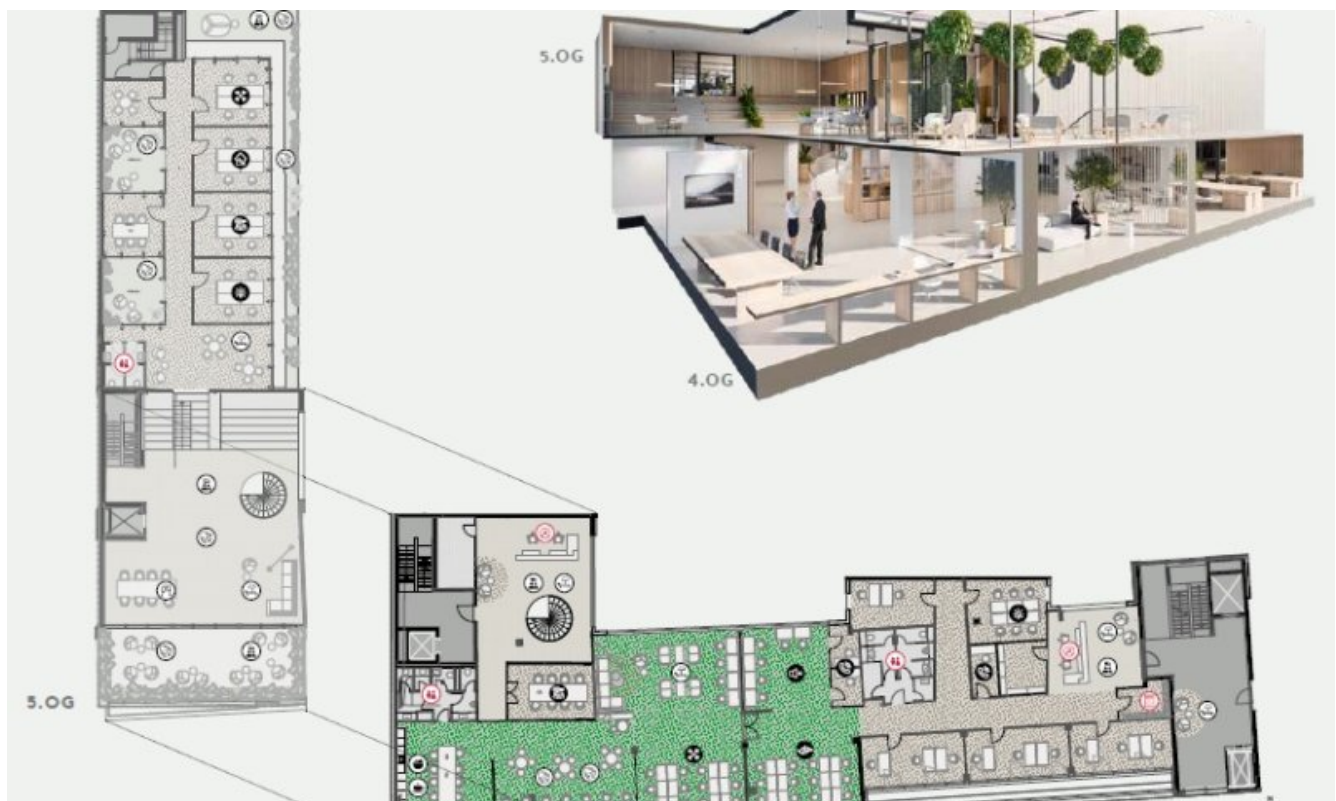
Grundrissbeispiel The Penthouse (Grundriss)