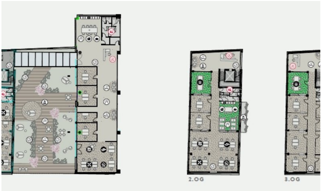
Grundrissbeispiel The Berlich (Grundriss)