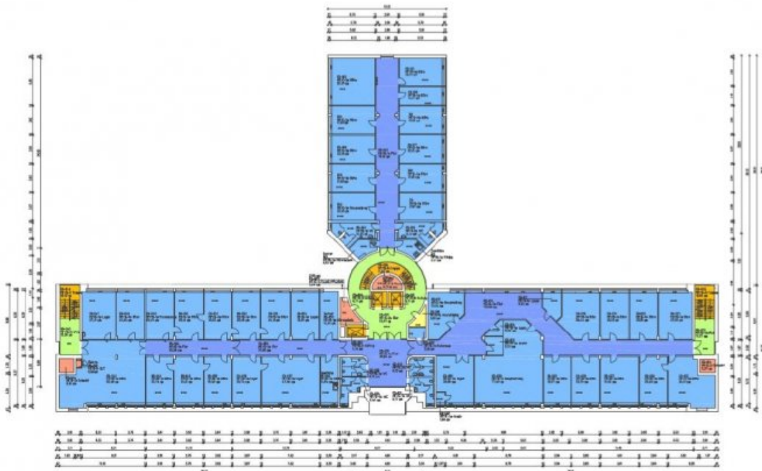
GRUNDRISS 3. OBERGESCHOSS