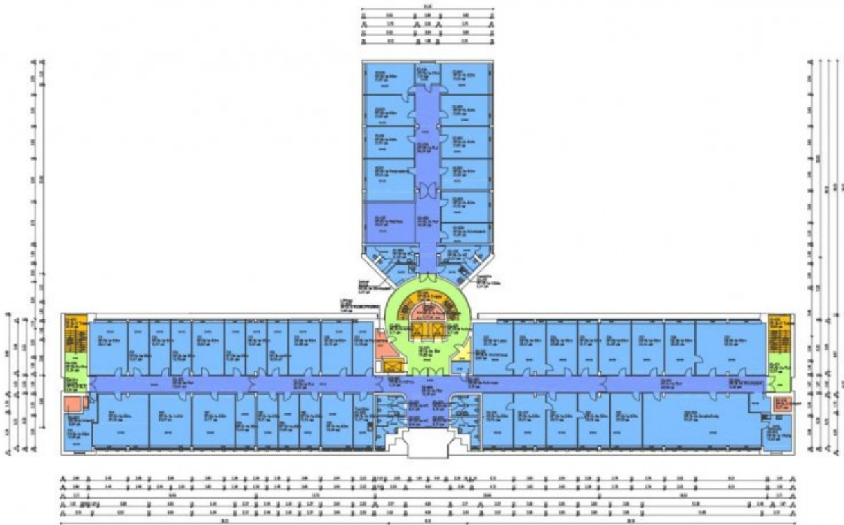
GRUNDRISS 2. OBERGESCHOSS