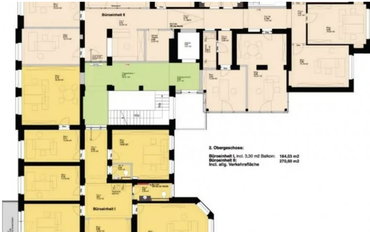
Grundrissplan 2.OG (Grundriss)